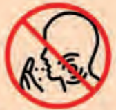
Mund und Nase beim Husten oder Niesen abdecken. Beschriften Sie die Hust- und Niesetikette