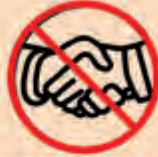
Verzichten Sie auf Umarmungen und Handschütteln