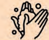
Waschen Sie Ihre Hände nach dem Husten oder Niesen