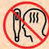
Gehen Sie bei grippeähnlichen Symptomen zum Arzt

Auf Sportanlagen wird die Zahl der Teilnehmer im Rahmenkonzept nach der Größe der Sportanlage sachgerecht begrenzt. Weitergehende oder ergänzende Anordnungen der örtlich zuständigen Behörden zu den Bestimmungen dieser Verordnung oder der auf ihrer Grundlage erlassenen Schutz- und Hygienekonzepte bleiben unberührt. Bitte informieren Sie sich jeweils bei Ihrer örtlich zuständigen Kreisverwaltungsbehörde (insbes. Gesundheitsamt am örtlichen Landratsamt bzw. Internetseite des Landratsamtes)!