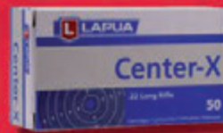
Lapua Center X

Gebrauchte Waffen! Große Auswahl! (Alles Einzelstücke!)