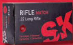
SK Rifle Match