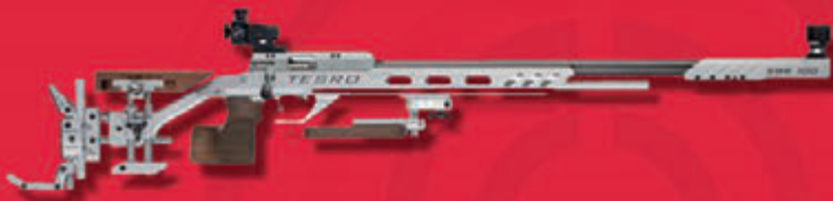
Tesro KK Gewehr SBR100 Signum ab 2.999,00 Euro