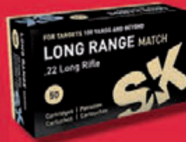
SK Long Range Match