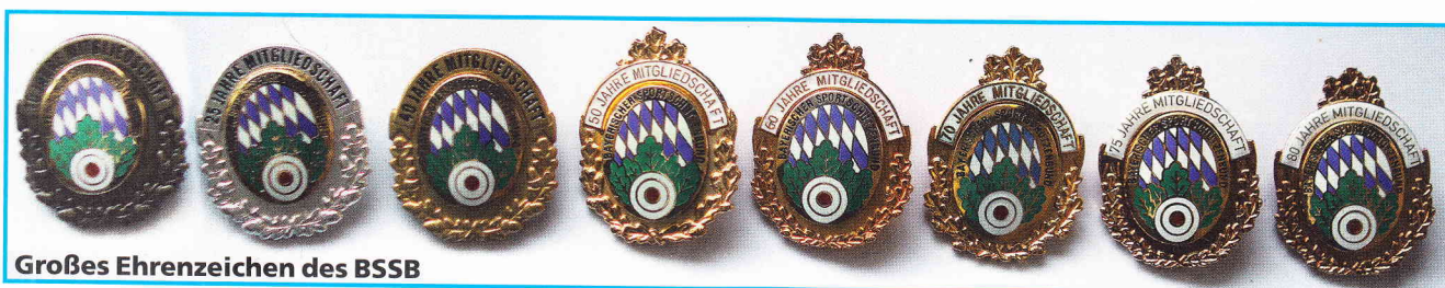
Großes Ehrenzeichen des BSSB