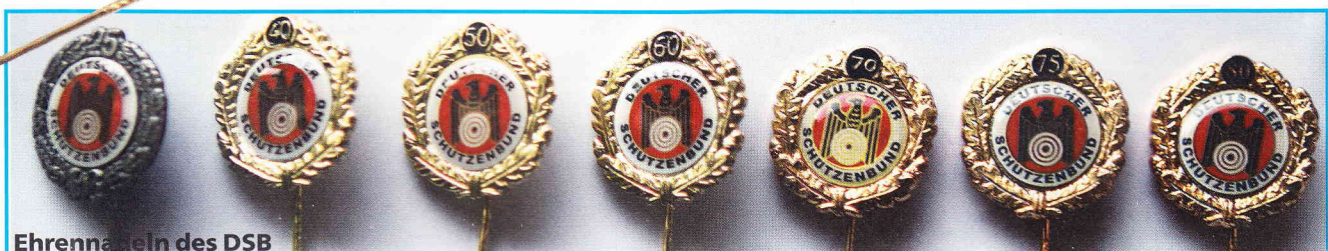
Ehrennadeln des DSB