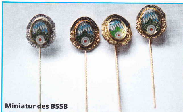
Miniatur des BSSB

alle Preise inkl. MwSt., zzgl. Versandkosten